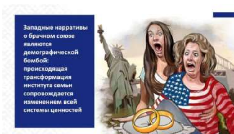
Слайд 7. Западные нарративы о брачном союзе (карикатура)

Фактически в большинстве стран Европейского союза и США отчетливо наблюдается отход от традиционной модели общества в направлении бездетных семей, семей с родителями-одиночками или однополыми родителями. При этом западные нарративы о брачном союзе являются демографической миной , ведь происходящая трансформация института семьи