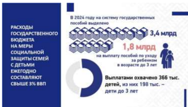
Слайд 12. Выделение государственных пособий семьям

В нее входят, как мы видим, государственные пособия при рождении и воспитании, семейный капитал, социальная помощь и соцслужги, гарантии в различных сферах и др.